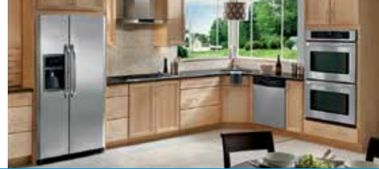
Table de cuisson