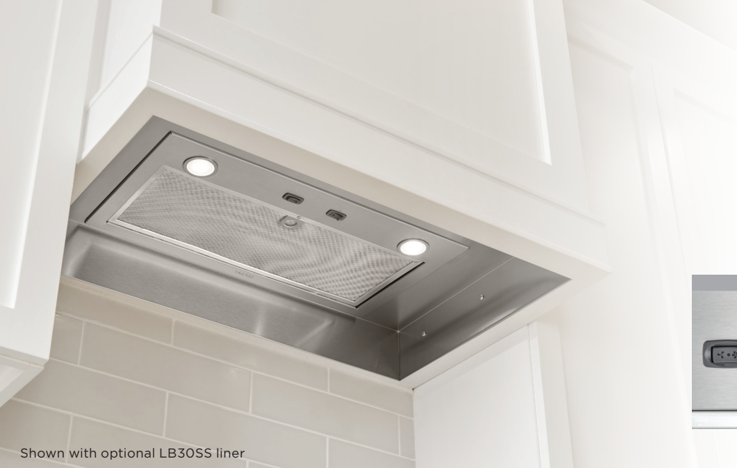
Shown with optional LB30SS liner