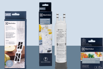
ELXPAAF2 EPPWFU01 ELPAPKRF

Recharge PureAdvantage MD Produce Keeper MC