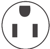
Type de fiche (NEMA) 5-15P

1 Garantie du système scellé 5 ans / pleine garantie pièces et main-d'œuvre 1 an.