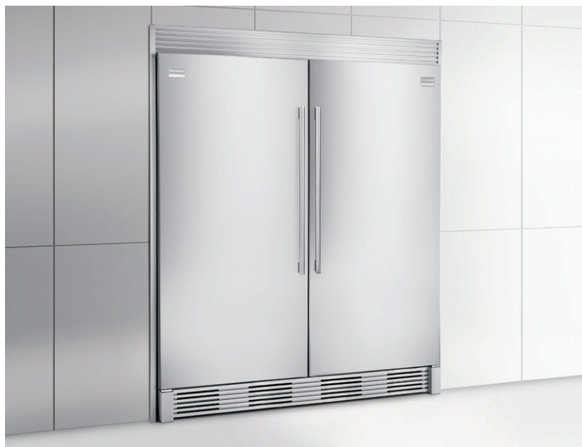
Illustré avec le tout réfrigérateur assorti, modèle FPRU19F8QF, et l'ensemble de garnitures avec longue grille persienne (TRIMKITEZ2) en option.