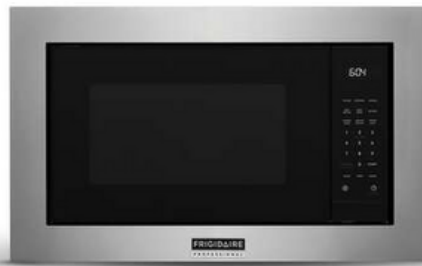
30" Stainless trim kit PMTK3080AF