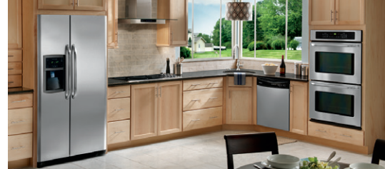
Table de cuisson