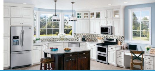
Table de cuisson encastrable