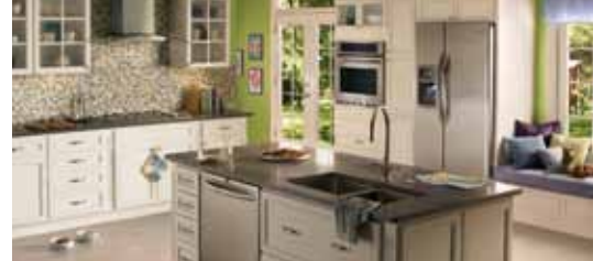
Table de cuisson