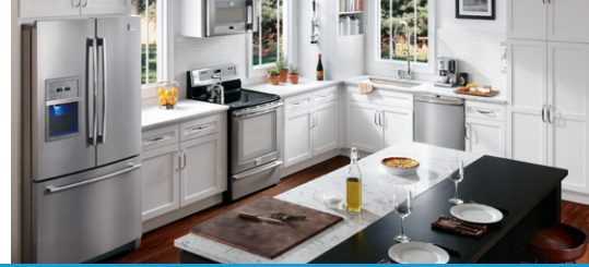
Table de cuisson encastrable