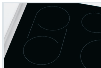
Élément intermédiaire SpaceWise MD Un élément adaptable vous permet de combiner deux éléments en un seul et convient aux ustensiles de cuisson de grande taille.