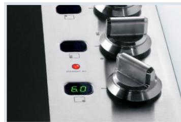
Commandes Pro-Select MD Un contrôle précis au bout des doigts.