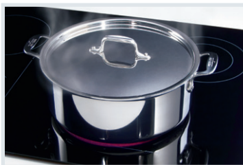
Ébullition PowerPlus MD Ébullition rapide de l'eau.