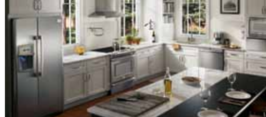
Table de cuisson