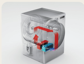
Sécheuse DirectDrive MD avec pompe à chaleur

Sécheuse intelligente à chargement frontal d'une hyper grande capacité de 7,8 pi 3 avec technologie de pompe à chaleur à double onduleur