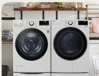
Facilité d'installation et d'entretien - conception sans évier et condenseur à nettoyage automatique