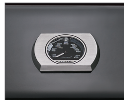
Jauge de température ACCU-PROBE™