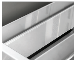
Plaques de brûleur à deux niveaux en acier inoxydable