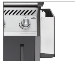
Tablettes latérales rabattables